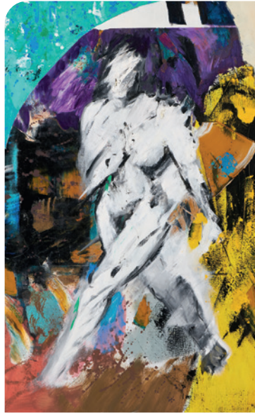
Œuvre : Emmanuel Bornstein, Run III , huile sur toile, 200 x 150 cm, 2019 – Courtesy Galerie Crone, Berlin Wien et de l'artiste. Photo : Sebastian Schobbert, Berlin.

En dialogue avec l'architecture et les espaces du château de Laréole, au nord de Toulouse, le peintre franco-allemand présente tout au long de l'été un ensemble exceptionnel de 29 œuvres, créé dans son atelier à Berlin depuis 2011. Le patrimoine et la peinture contemporaine s'unissent pour révéler l'ampleur des gestes créatifs de l'artiste, forgés par son histoire personnelle et familiale, les révolutions et les bouleversements du XX e siècle, ainsi que par l'histoire artistique. Partenariat Kunsthalle Rostock.