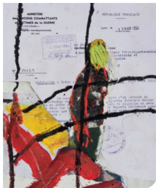
Œuvre : Emmanuel Bornstein.

Tél. 05 34 33 17 40 52 allées des Demoiselles 31000 TOULOUSE