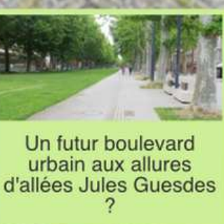
Un futur boulevard urbain aux allures d'allées Jules Guesdès

La traversée de Pinsaguel en vélo aux heures de pointe est impossible. Les chauffeurs ne servent à rien puisque remplis de voitures.