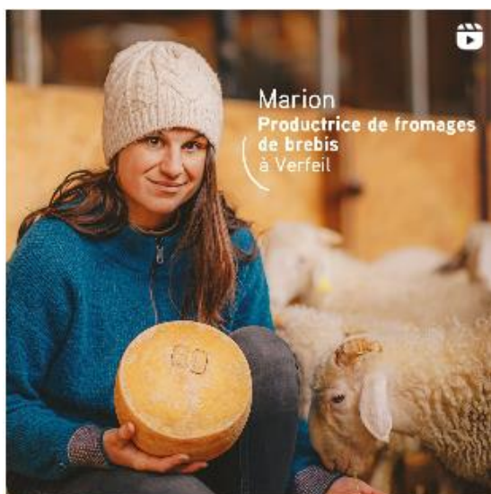
Promotion sur les Réseaux Sociaux