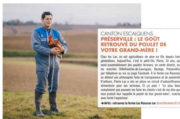
Article Haute-Garonne Magazine