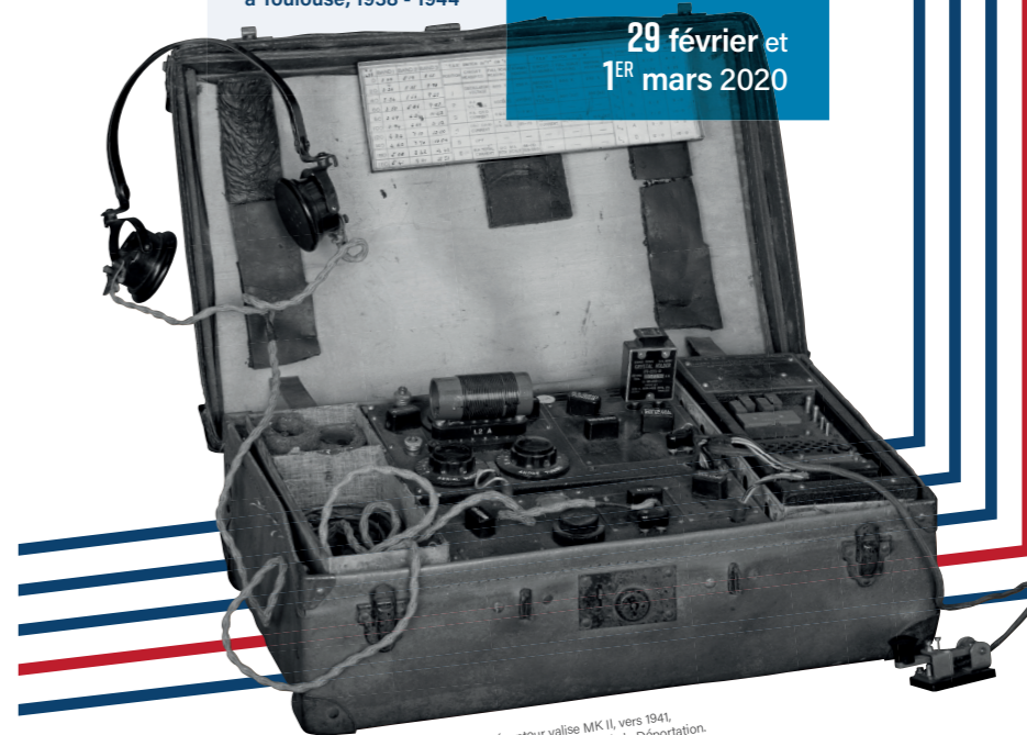
Poste radio émetteur-récepteur valise MK II, vers 1941. Musée départemental de la Résistance & de la Déportation. Don Monier, inv. 994.41