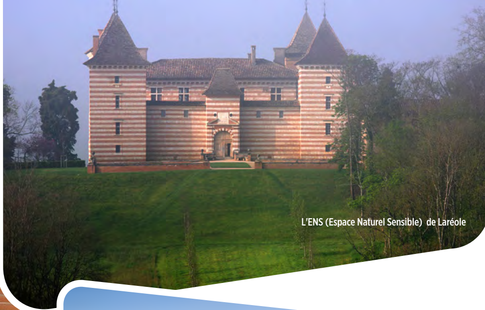
L'ENS (Espace Naturel Sensible) de Laréole