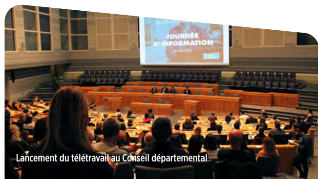
Lancement du télétravail au Conseil départemental

Un livret contre le gaspillage alimentaire a été rédigé par le Conseil départemental des collégiens, et salué au niveau national par le prix « Démocratie jeunesse » attribué dans le cadre des trophées éco-actions. Dans cette dynamique d'économie circulaire, une meilleure gestion des déchets est déjà opérationnelle dans une cinquantaine de collèges, avec le tri et la valorisation des biodéchets .