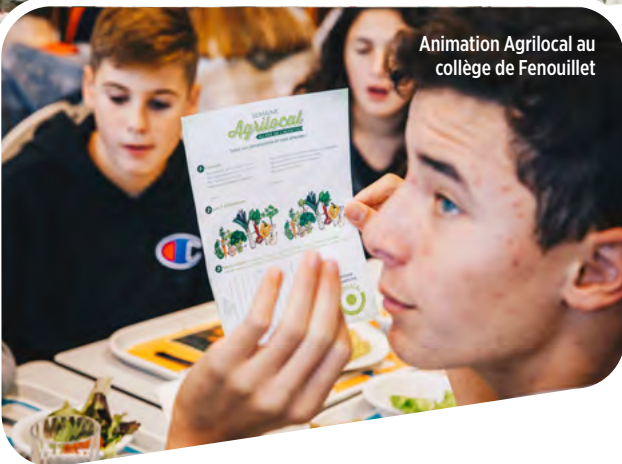
Animation Agrilocal au collège de Fenouillet

Il convient de rappeler que grâce à l'apport financier du Département pendant cinq ans dans cette opération, les fonds européens (FEADER) ont pu être mobilisés, ce qui représente un investissement efficace pour accompagner les éleveurs dans l'évolution de leurs pratiques.