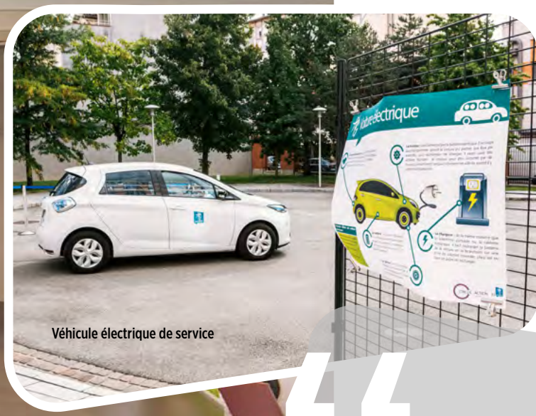
Véhicule électrique de service