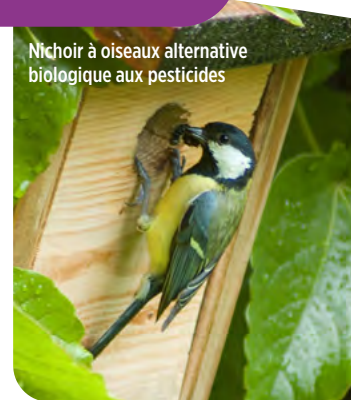
Nichoir à oiseaux alternative biologique aux pesticides