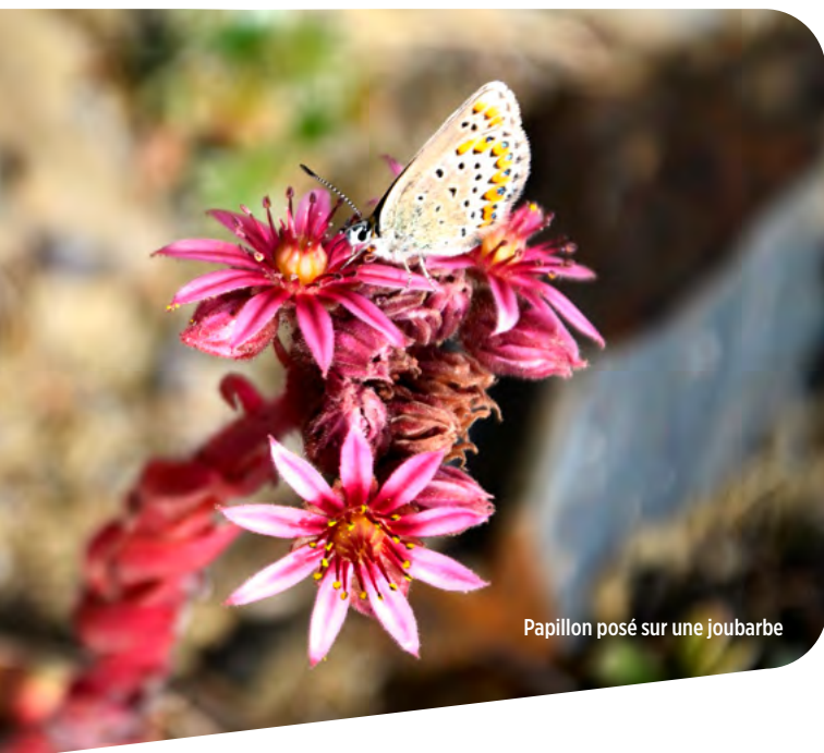
Papillon posé sur une joubarbe

Chaque année, dans le cadre des programmes de gestion de site qui s'imposent aux ENS, l'évènement « la forêt de Buzet dans tous ses états » accueille de nombreux visiteurs autour d'animations destinées aux scolaires mais aussi au grand public : des balades contées au cœur de cette belle forêt départementale, des séances sportives, des ateliers ludiques pour découvrir des trésors naturels parfois inattendus.