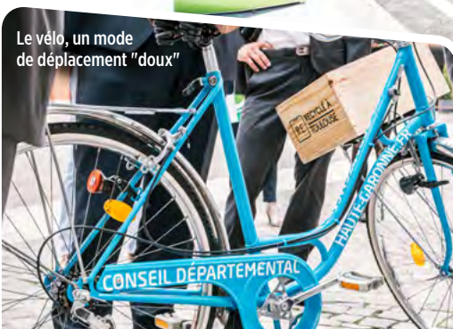
Le vélo, un mode de déplacement "doux"