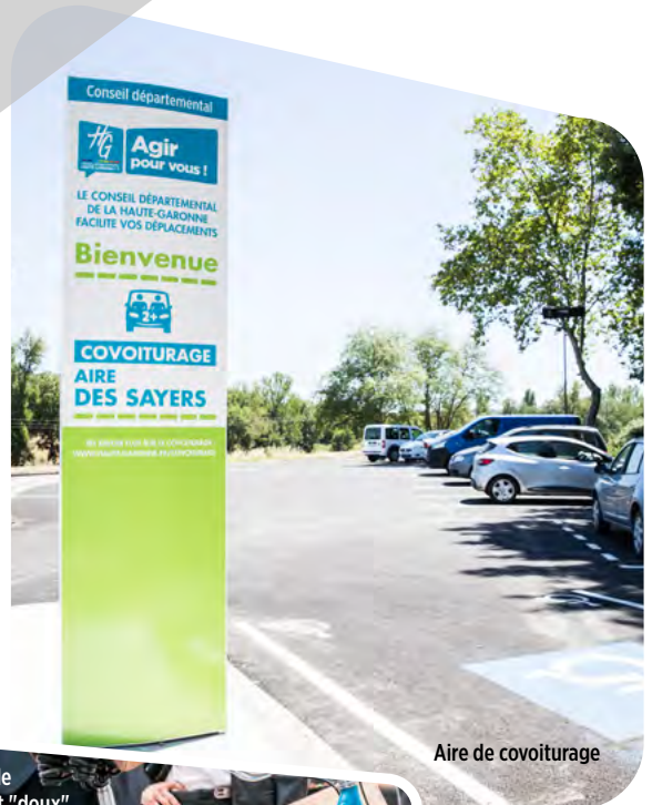
Aire de covoiturage

Maintenir la voiture individuelle au centre des mobilités du quotidien est d'autant plus difficile pour nos concitoyens qu'elle est source de dépenses importantes dans le revenu des ménages. Il est donc de notre responsabilité de construire une mobilité durable basée sur une offre de transports diversifiée et respectueuse du cadre de vie. C'est pourquoi depuis 2018, avec l'Etat, la Région Occitanie, Toulouse Métropole et Tisséo Collectivités, le Conseil départemental de la Haute-Garonne a réalisé des études multimodales destinées à explorer tous les leviers d'actions pour améliorer la mobilité dans l'agglomération toulousaine. Les études identifient le vélo comme un mode de transport ayant un fort potentiel d'utilisateurs en termes de report modal sur les trajets domicile-travail. Aussi, le Conseil départemental de la Haute-Garonne propose la mise en place d'itinéraires cyclables à haut niveau de service, appelés « Réseau Express Vélo », alliant sécurité, continuité, lisibilité et confort pour ses utilisateurs.