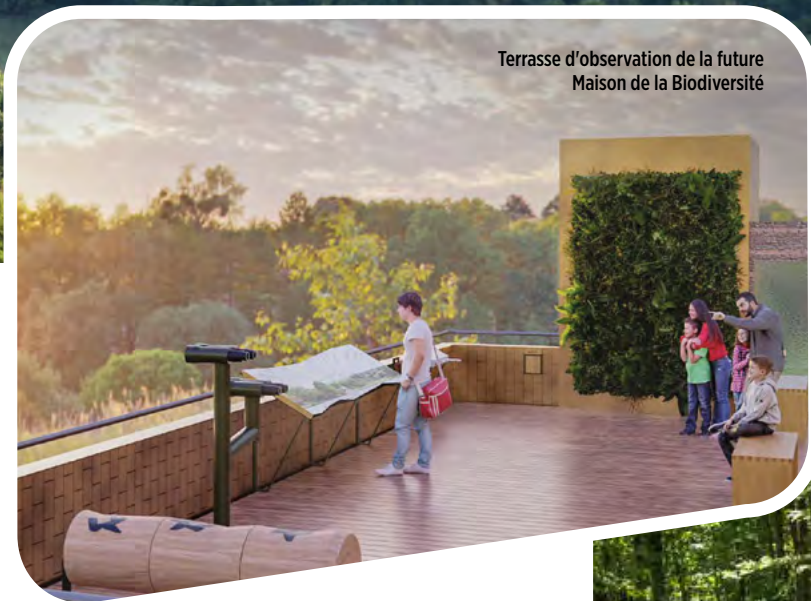
Terrasse d'observation de la future Maison de la Biodiversité