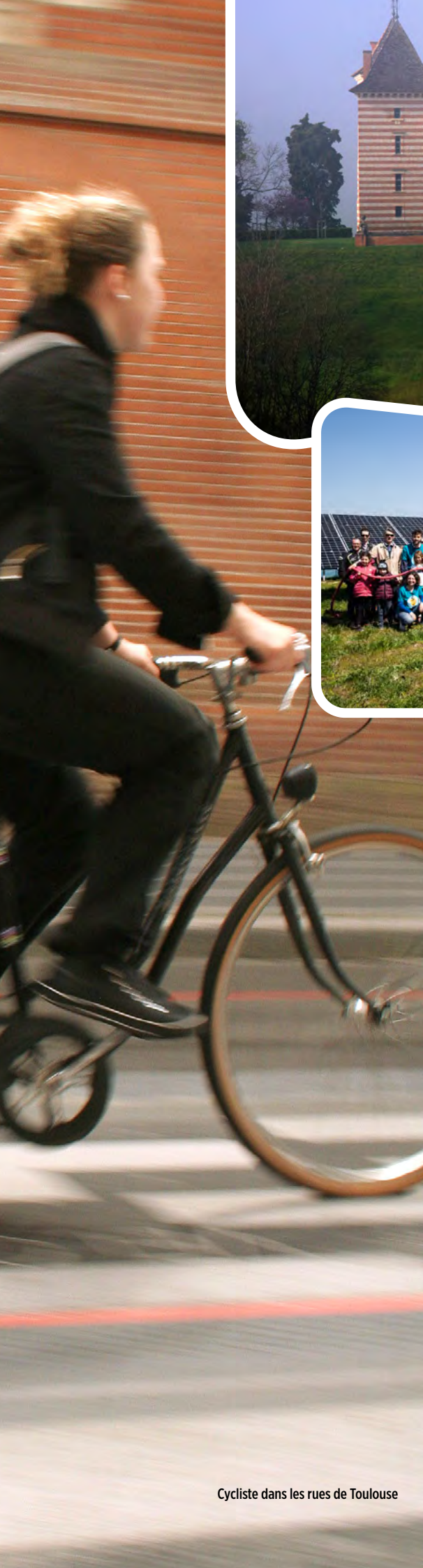
Cycliste dans les rues de Toulouse