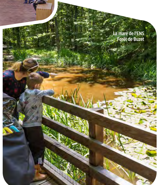
La mare de l'ENS Forêt de Buzet

Dans son action de sensibilisation des plus jeunes et sur le modèle du kit d'animation « Agir pour le climat ! » réalisé en 2018, Haute-Garonne Environnement proposera dès la fin 2019 un nouvel outil pédagogique sur la biodiversité composé de différents modules destinés aux écoles élémentaires et aux collèges. L'objectif est de faire connaître un ensemble de bonnes pratiques par le biais d'animations ludiques afin d' éduquer les écocitoyens de demain .