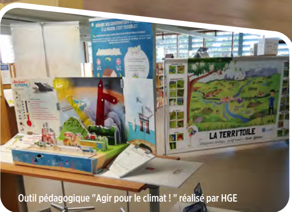
Outil pédagogique "Agir pour le climat !" réalisé par HGE

Président de Haute-Garonne Environnement Conseiller départemental du canton de Blagnac