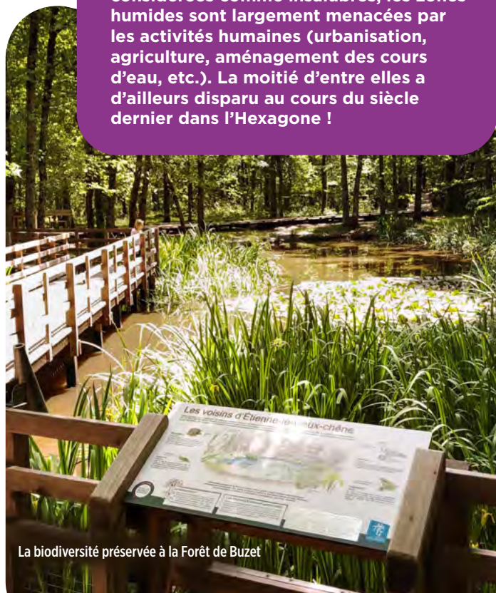
La biodiversité préservée à la Forêt de Buzet

Méconnues, voire même souvent considérées comme insalubres, les zones humides sont largement menacées par les activités humaines (urbanisation, agriculture, aménagement des cours d'eau, etc.). La moitié d'entre elles a d'ailleurs disparu au cours du siècle dernier dans l'Hexagone !