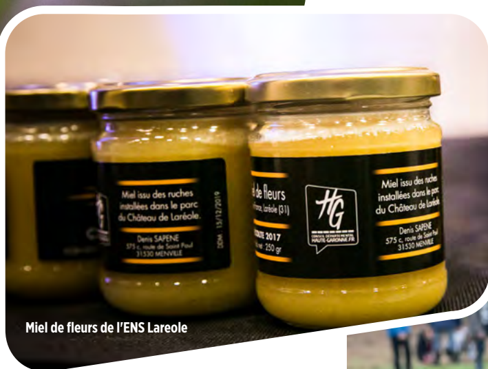
Miel de fleurs de l'ENS Laréole

Toutes ces installations de ruches ont été couronnées de succès avec, à la clé, une bonne récolte de miel. Ces ruches viennent renforcer le réseau d'alerte animé par le Groupement de défense sanitaire apicole, en vue d'informer ses membres de menaces éventuelles qui pourraient affecter leurs ruchers.