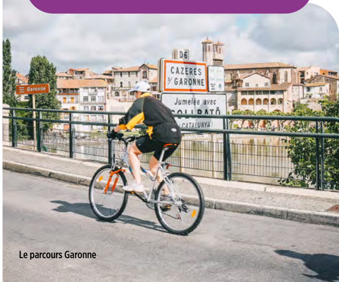
Le parcours Garonne

En charge de l'élaboration du Plan Départemental des Itinéraires de Promenade et de Randonnée (PDIPR), le Conseil départemental de la Haute-Garonne poursuit l'accompagnement administratif et technique des collectivités de la Haute-Garonne pour l'inscription de nouveaux sentiers non motorisés qui participent à la découverte des richesses naturelles, paysagères et patrimoniales du département. Des aides financières sont accordées pour permettre aux maîtres d'ouvrages, communes et groupements de communes, de financer l'aménagement et la gestion des sentiers, la signalétique d'interprétation, ou encore l'acquisition d'écocompteurs.