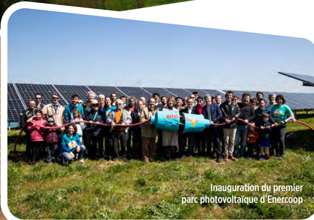
Inauguration du premier parc photovoltaïque d'Enercoop