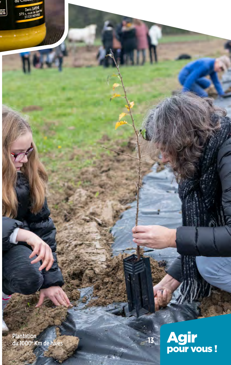
Plantation du 1000 e Km de haies

En offrant un habitat, de la nourriture et des lieux de circulation à toute une faune, la haie participe à l'équilibre écologique de nos territoires.