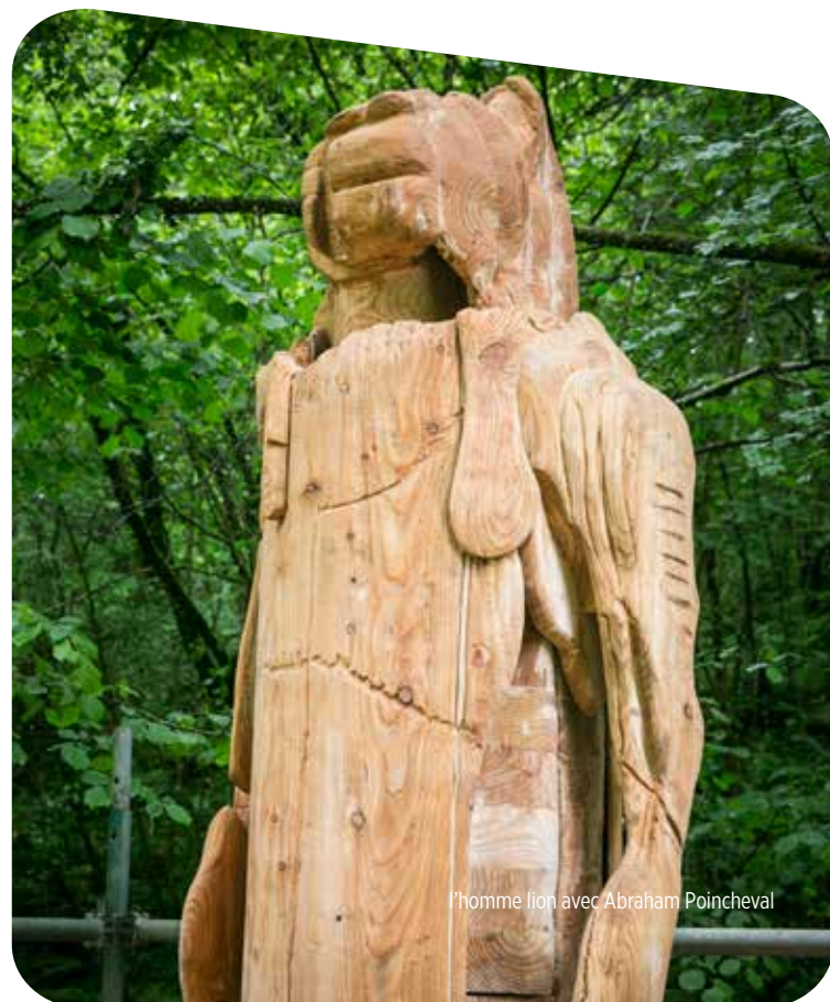
l'homme lion avec Abraham Poincheval

personnes présentes aux journées d'inauguration du nouveau Musée départemental de la Résistance et de la Déportation de Toulouse