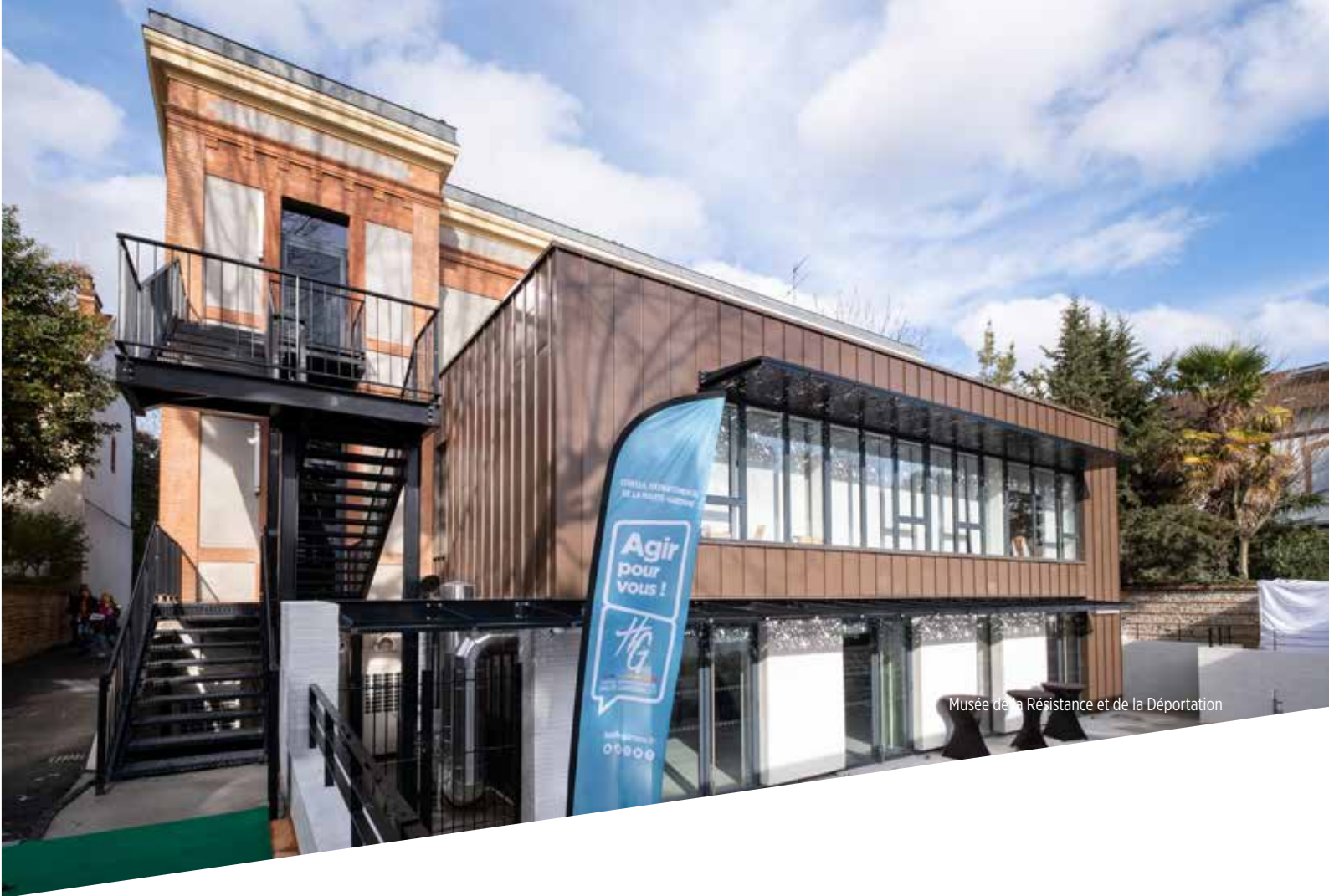
Musée de la Résistance et de la Déportation