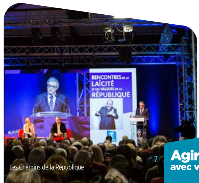
Les Chemins de la République

A titre d'exemple, les Rencontres pour l'égalité, des conférences, débats, expositions et projections sont proposées au grand public pendant une semaine sur le thème de la lutte contre toutes les formes de discriminations.