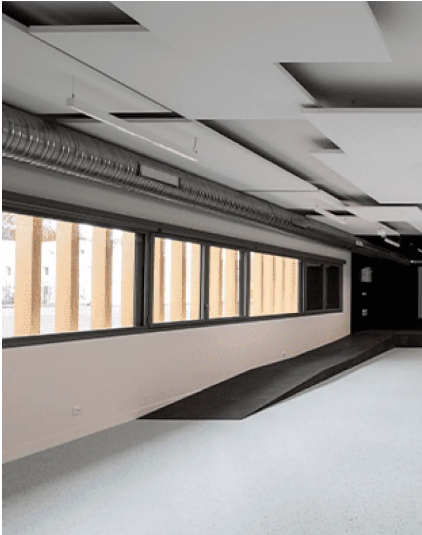
Le nouveau collège de Saint-Simon en chiffres