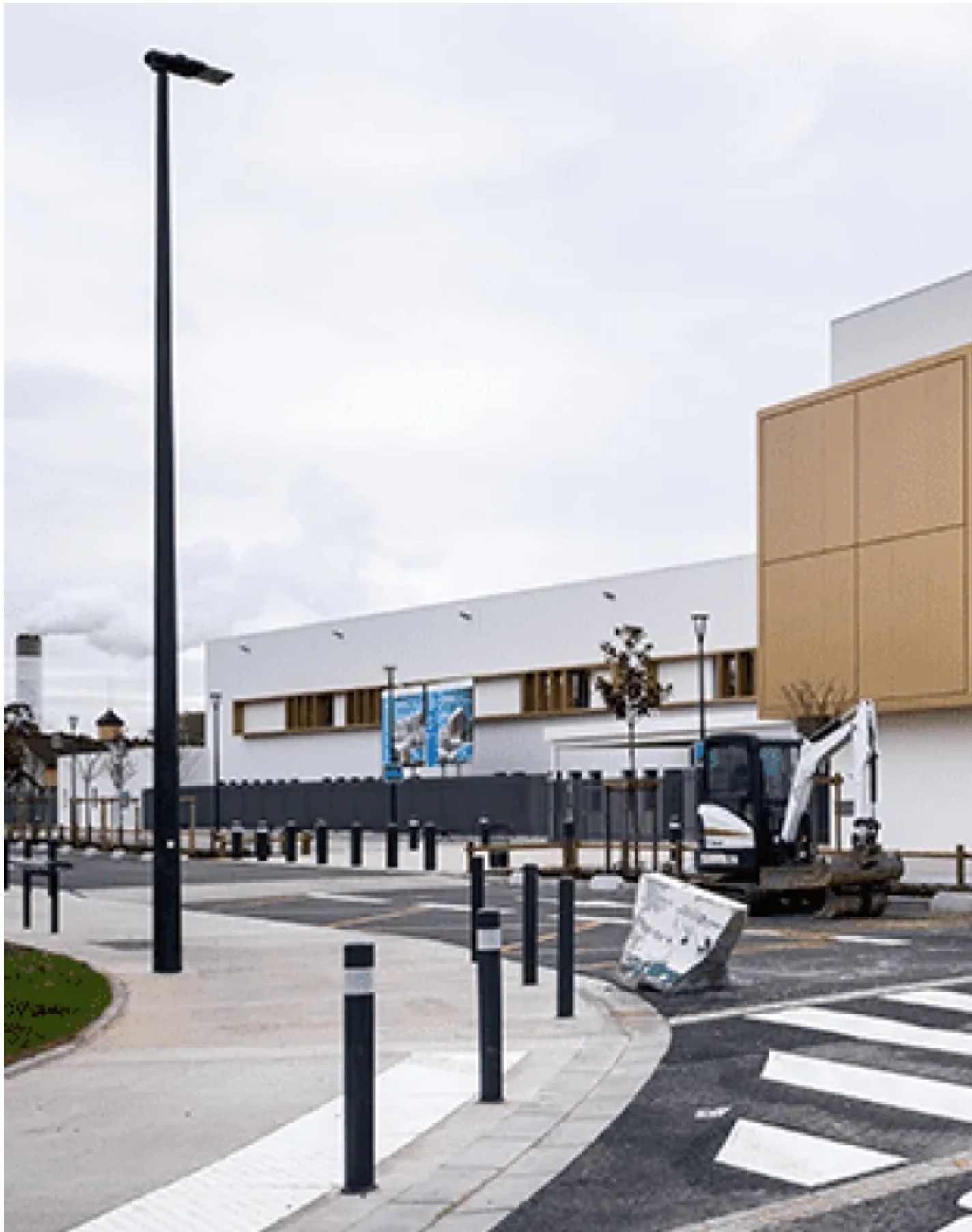
Un collège à énergie positive