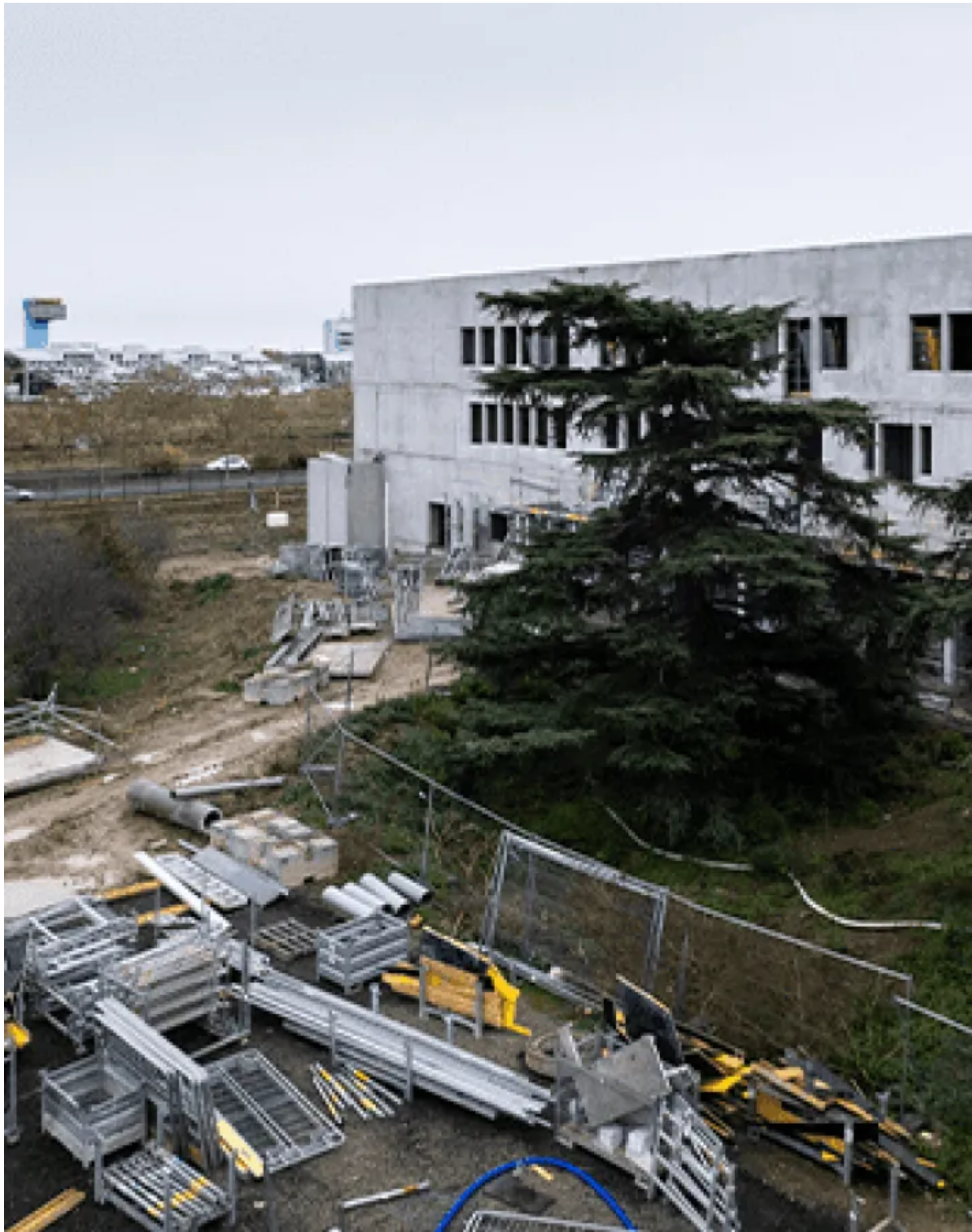
Collège à énergie positive