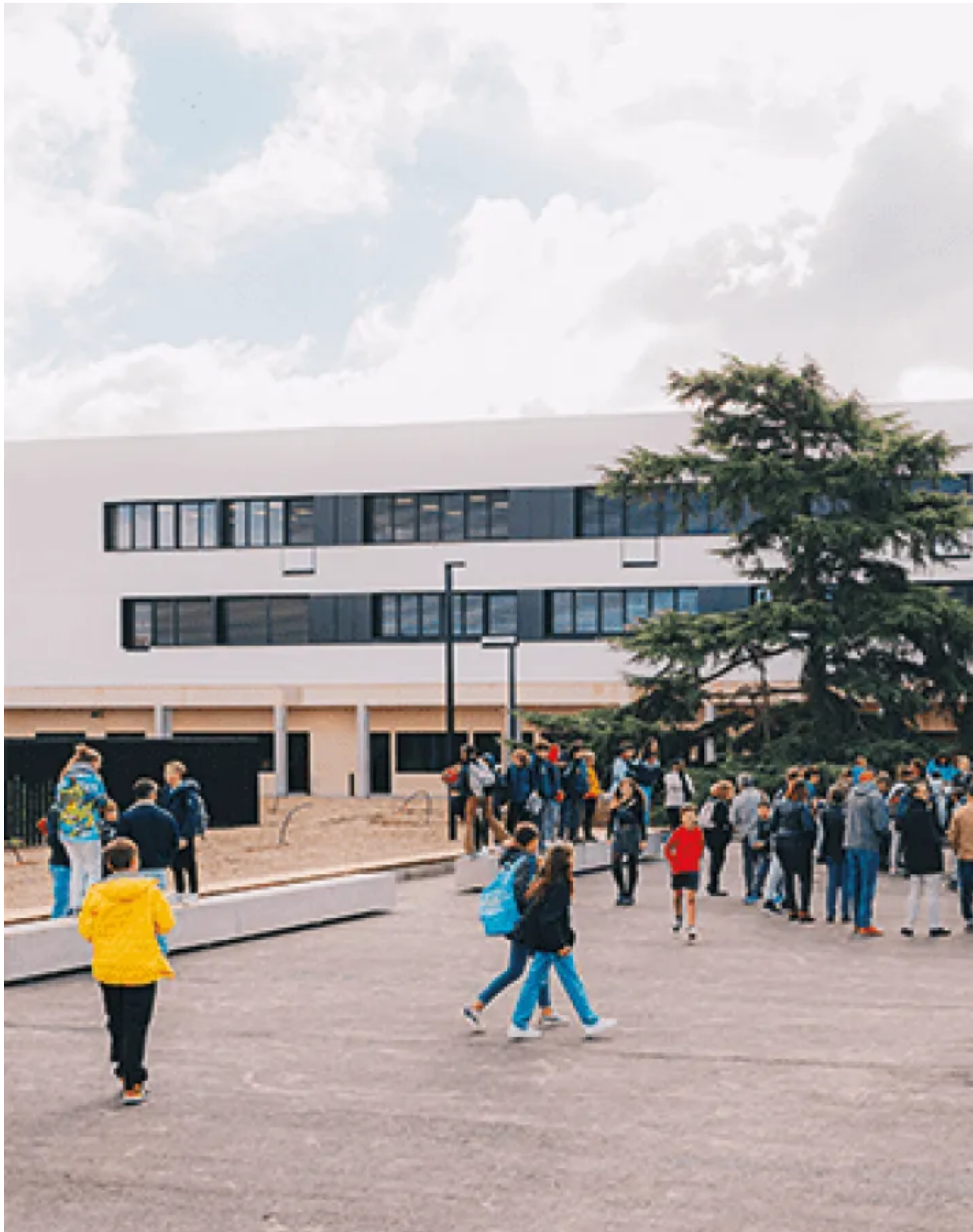
Les 600 élèves du collège de Guilhermy ont assisté à l'inauguration de leur nouvel établissement le 30 septembre dernier, en présence de Georges Méric et des conseillers départementaux. Ce nouveau collège est