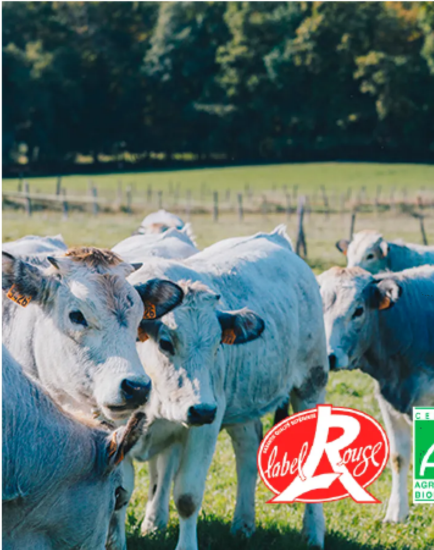
La Gasconne labellisée