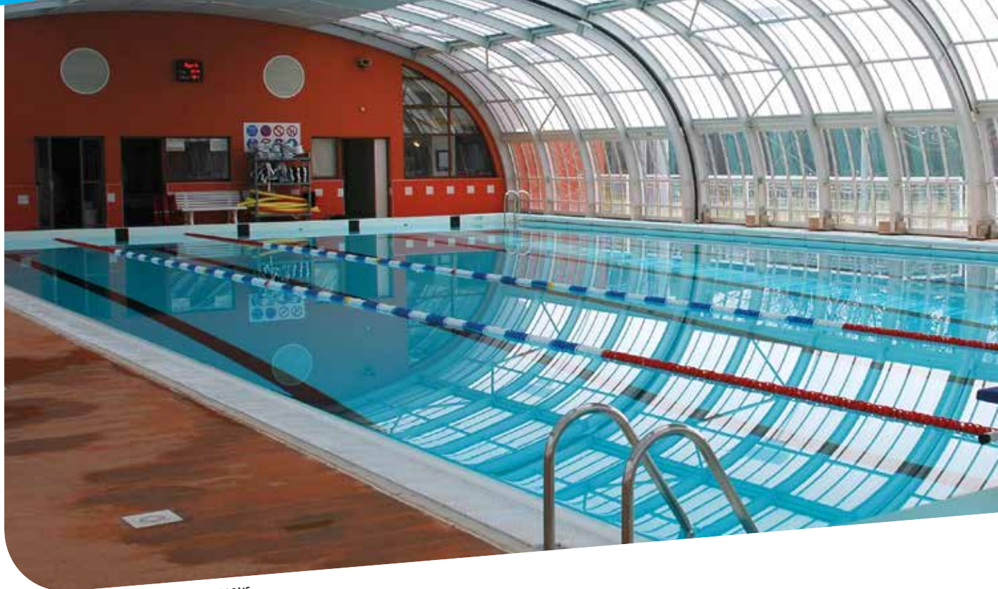
> PISCINE VILLEFRANCHE-DE-LAURAGAIS