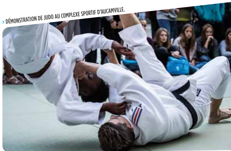
> DÉMONSTRATION DE JUDO AU COMPLEXE SPORTIF D'AUCAMVILLE.