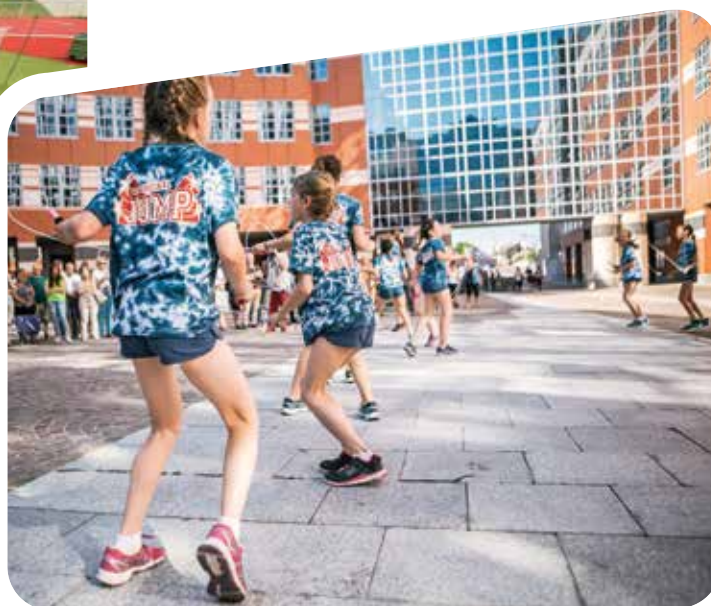
> DÉMONSTRATION LORS DE LA REMISE DE DOTATIONS AUX ÉQUIPES ET ASSOCIATIONS SPORTIVES DE LA HAUTE-GARONNE.