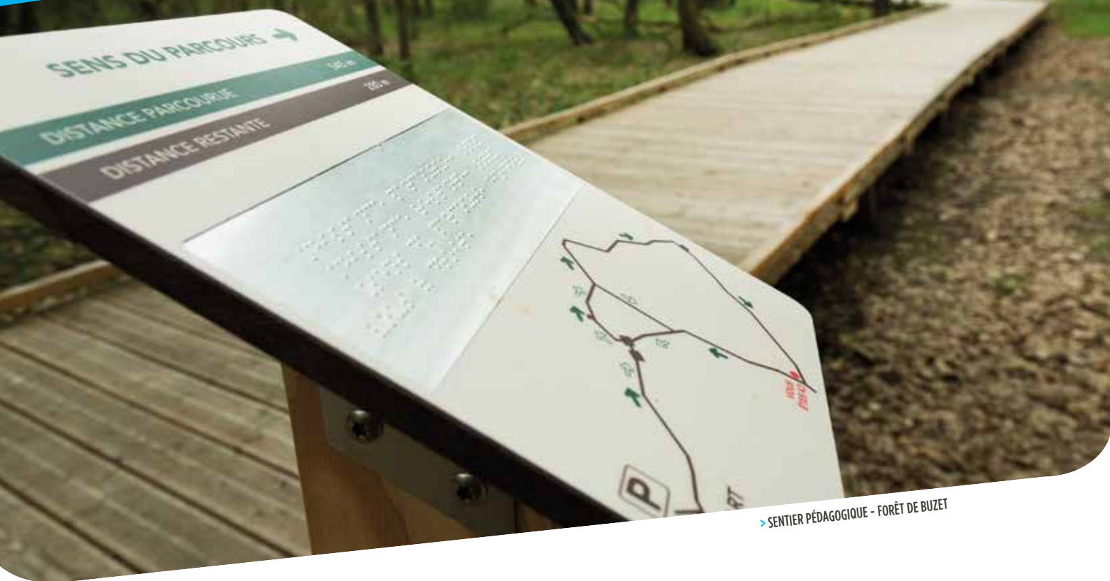
> SENTIER PÉDAGOGIQUE - FORÊT DE BUZET