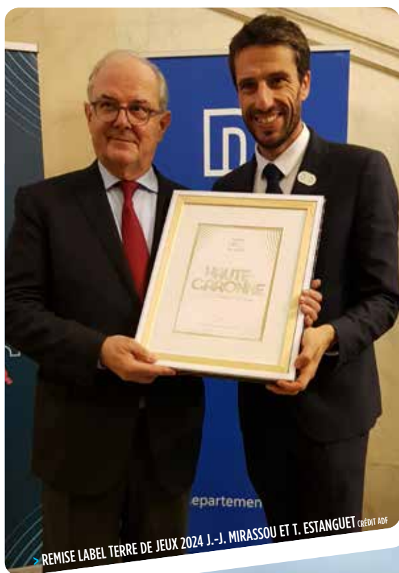
> PIC DE CAGIRE

Le département de la Haute-Garonne est un territoire sportif, riche d'une variété de reliefs et d'équipements de qualité, propices à une pratique sportive diverse. Le Conseil départemental développe une politique riche, transversale et qui ambitionne de développer le sport pour tous et sur tous les territoires. Avec des nouveaux axes tels que le sport santé ou la lutte contre les dérives dans le sport, le Conseil départemental répond aux attentes nouvelles des habitants de la Haute-Garonne et cherche à valoriser les valeurs que le sport inculque dès le plus jeune âge. L'accompagnement des associations, des collectivités territoriales, des athlètes de haut-niveau, des bénévoles illustrent cette politique volontaire du Conseil départemental. La Haute-Garonne dispose en outre d'un niveau de jeu et d'une culture sportive qui dynamisent incontestablement son image et son territoire. Par une pratique d'excellence, les clubs et athlètes haut-garonnais valorisent le territoire et contribuent ainsi à sa promotion et à son développement, et ce sur tous les terrains.