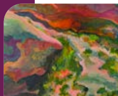
Lucile Martinez « Tardevant » (détail), acrylique et encre sur carton bois, 80 x 120 cm