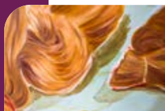
Marie Zawieja « Encore une fois » (détail), huile sur toile, 2018.