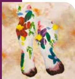
Jérôme Souillot série « Les Sommes », acrylique sur bois. 2022